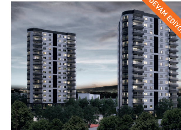
ASM-ÖNİZ KONUTLARI (ELVANKENT)